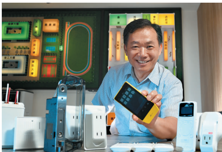
▲ EzCon，讓使用者可以隨時隨地輕鬆遙控各種系統，是全球客戶以更安全且便捷的生活方式，為綠色地球盡上一份心力。